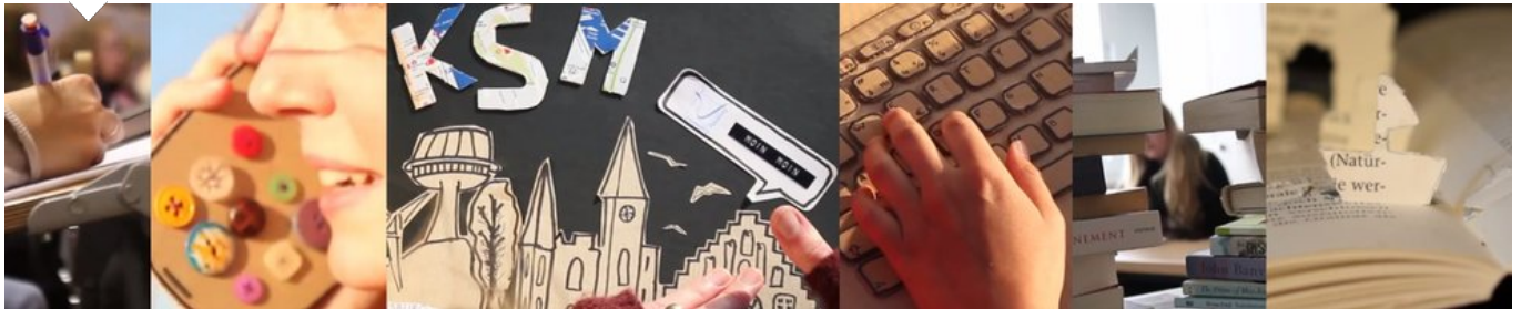
Startseite der EUF > Portal „Studium und Lehre“ > Studiengänge > Master > Kultur – Sprache – Medien (KSM)