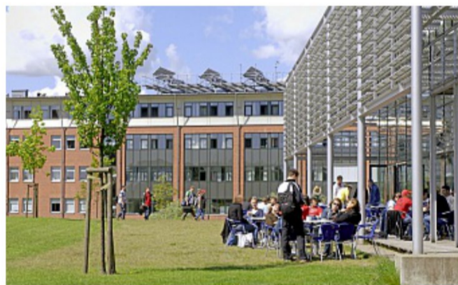
Die EUF ist aus einer Pädagogischen Hochschule hervorgegangen. Während viele andere Universitäten in Deutschland ein breites Spektrum von Medizin bis Jura abdecken, hat Flensburg seine Tradition als Zentrum für Bildungswissenschaften beibehalten und ausgebaut.

Alles begann kurz nach dem Zweiten Weltkrieg. Im März 1946 eröffneten die britischen Besatzer in der ehemaligen Marineschule Mürwik die Pädagogische Hochschule (PH) Flensburg. Damals wurden 92 Absolventen von sechs Dozenten unterrichtet. Die Briten wollten mit ihrer „Reeducation“-Politik, einer Umerziehungspolitik, demokratische Werte im Nachkriegsdeutschland verankern – Lehrkräfte spielten dabei