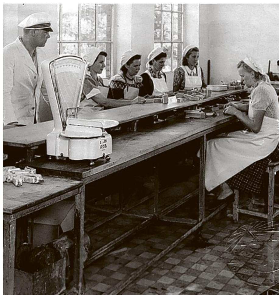
In Handarbeit wurde noch in den 50er Jahren das Trittauer Milli-Eis produziert. KREIS RCHIV