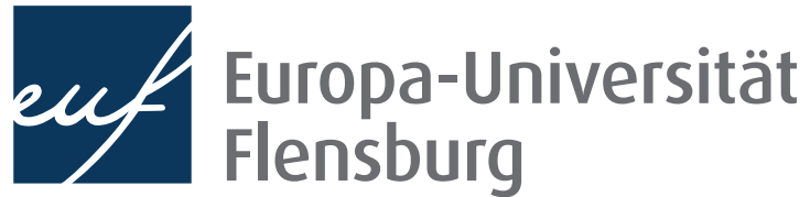
Logo in Hausfarben auf weißem Hintergrund