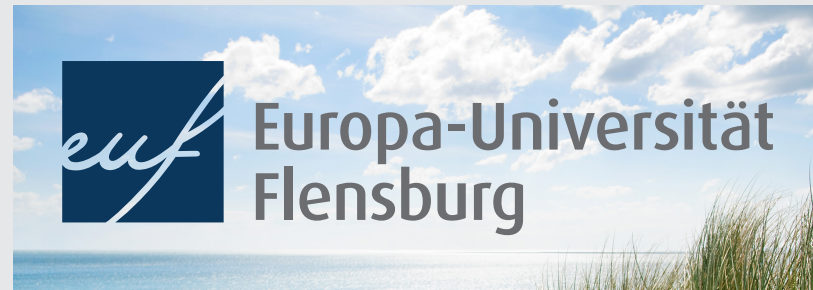
Logo in Hausfarben auf hellem Bildmotiv