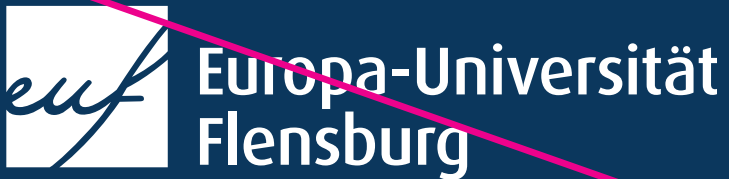
Logo in weiß auf farbigem Hintergrund