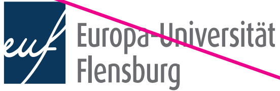
Veränderung der Proportionen