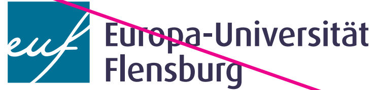
Verwendung nicht definierter Farben