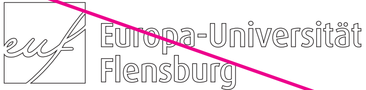
Verwendung einer Outline-Variante