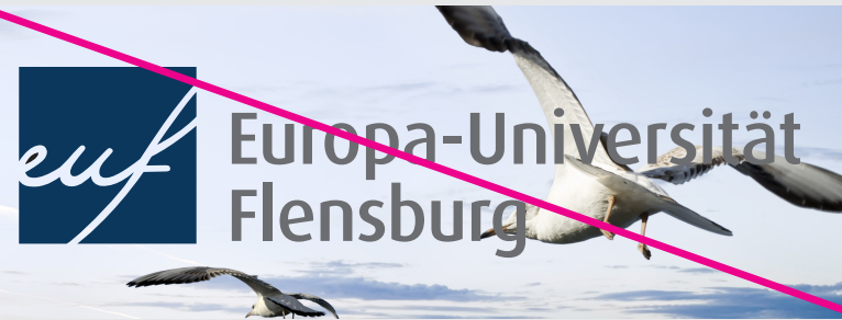
Verwendung auf ungünstigem Bildmotiv ohne weißen Rahmen