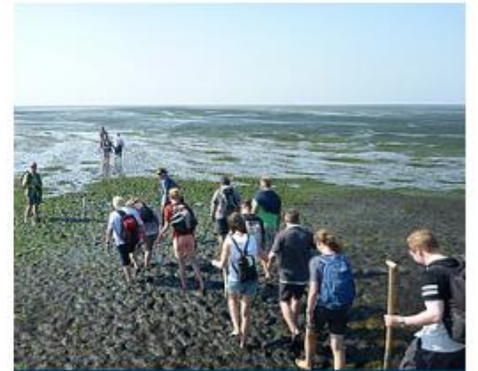
2016 - HALLIG HOOGE