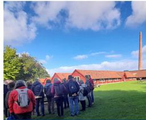
2022 - CATHRINESMINDE UND SONDERBORG