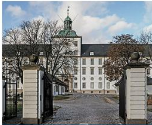
2023 - SCHLOSS GOTTORF