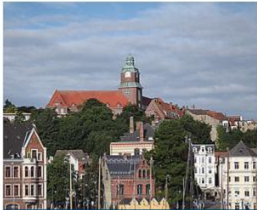
2024 - FLENSBURG