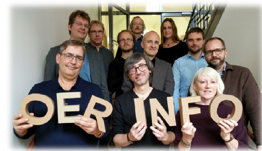
Das Team von OERinfo.