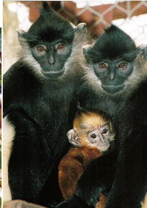
Bild 1: http://im.rediff.com/news/2012/oct/22species14.jpg (04.01.14)