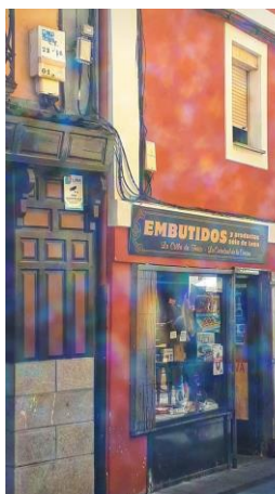
Klicken oder tippen Sie hier, um Text einzugeben.