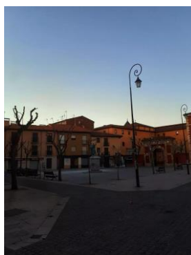
Klicken oder tippen Sie hier, um Text einzugeben.