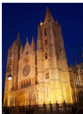
Die Kathedrale bei Nacht