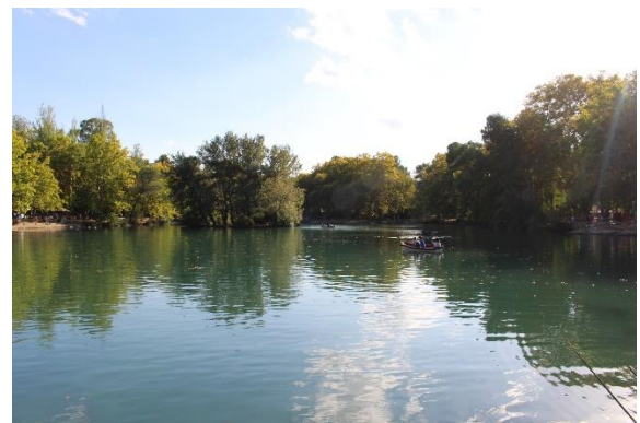
Und zum Schluss ein paar Bilder von den Ausflügen, die ich mit Happy Erasmus gemacht habe – die Landschaft ist wirklich schön und wandern lohnt sich!