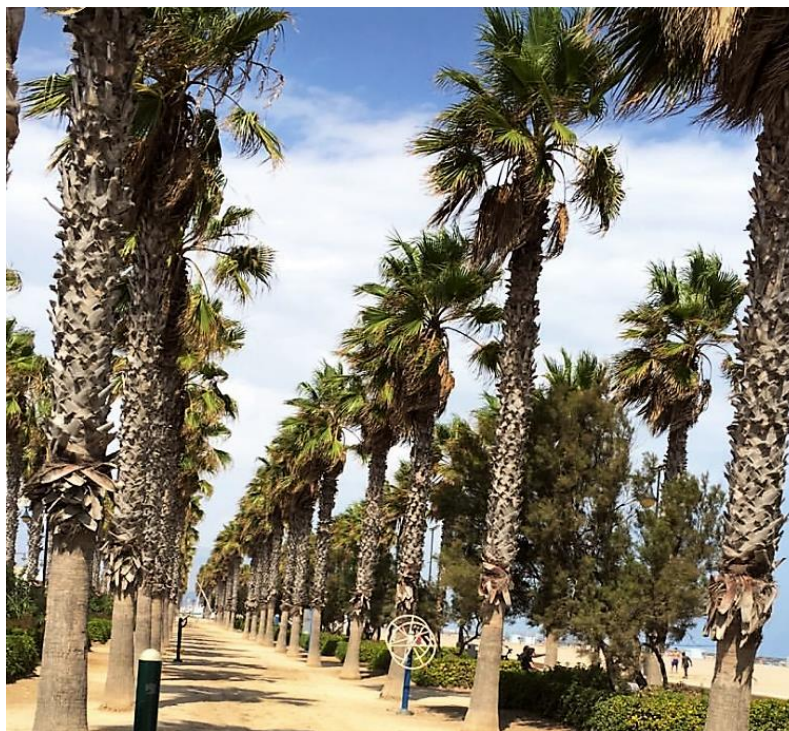
Die Promenade beim Playa de Malvarrosa