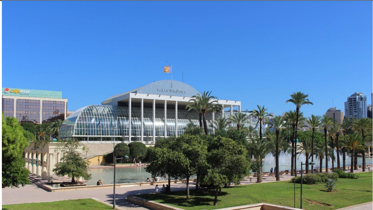
Palau de la Musica