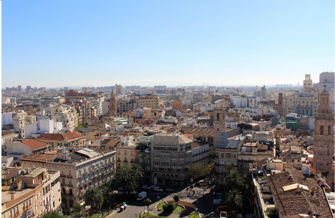
Valencia von oben aus El Micalet beim Plaza de la Reina

Fotos Hiermit erkläre ich, dass Rechte Dritter an dem/den unten näher bezeichneten Foto/s nicht bestehen und ich der EUF die Nutzung dieses/dieser Fotos gestatte Ja Nein