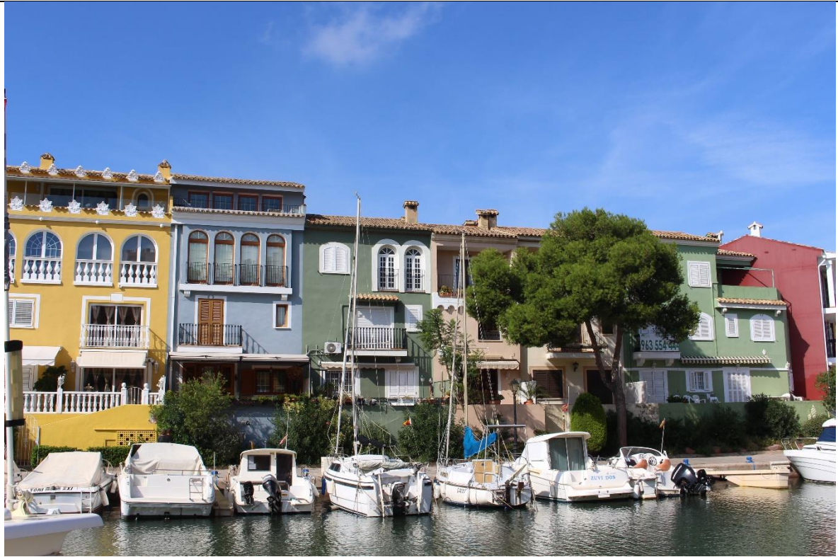
Port Saplaya oder „little Venice“ – ein schöner Ort ganz in der Nähe von Valencia