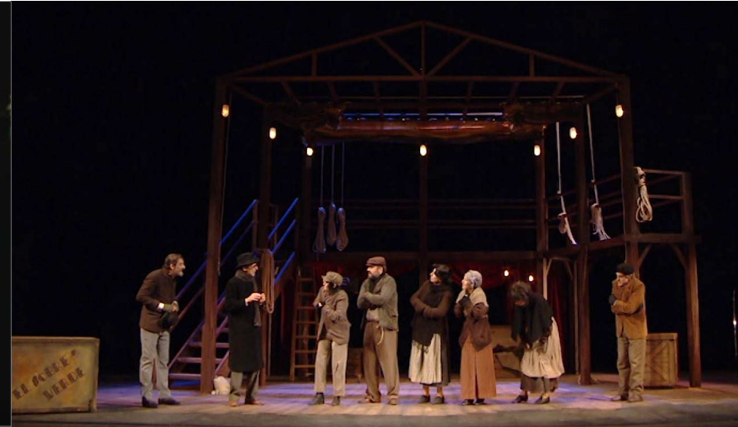
El sobre verde. Reestreno 2016. Min 1:02'23.