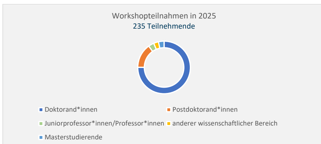
Tab. 1. Workshops