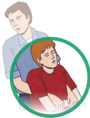
Person ggf. aus dem Gefahrenbereich retten