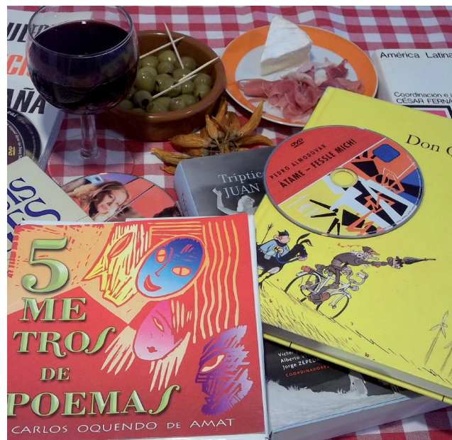
Ausschnitt aus „Drago“ Xul Solar, 1927

Spanisch ist neben dem Englischen die am häufigsten gesprochene Sprache europäischen Ursprungs. Immer mehr Schüler*innen wählen Spanisch als Fremdsprache, sodass landesweit gut qualifizierte Spanischlehrer*innen benötigt werden. Mit diesem Ziel können Sie Spanisch an der Europa-Universität Flensburg als Teilstudiengang im Bachelor Bildungswissenschaften und anschließend im Master für das Lehramt der Sekundarstufen I und II studieren.