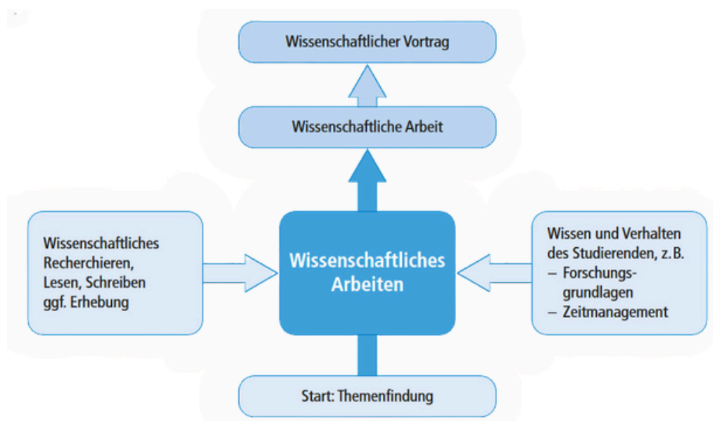
Abb. 1: Von der Idee zur wissenschaftlichen Arbeit (Voss, 2022, S. 21)

Als Dozierende der Abteilung freuen wir uns darauf, Sie in Ihrem Arbeitsprozess begleiten zu dürfen. Wir sind uns bewusst, dass gerade die Bachelorarbeit für einige die erste vertiefende Auseinandersetzung mit dem wissenschaftlichen Arbeiten bedeutet. Die Lektüre dieses Readers kann dabei im gesamten Arbeitsprozess als Orientierung gesehen werden, welche die Handreichungen zu den methodenspezifischen Gliederungen ergänzen. Die eigenständige Beschäftigung mit Literatur zum wissenschaftlichen Arbeiten ist weiterhin zwingend notwendig. Literaturhinweise dafür finden Sie am Ende des Readers. Auch weitere Veranstaltungen der Universität wie die Schreibwerkstatt können Sicherheit während des Schreibprozesses bieten. Die nachfolgende Grafik verdeutlicht den Entstehungsprozess einer wissenschaftlichen Arbeit, wobei der Vortrag an unserer Universität nicht für Abschlussarbeiten vorgesehen ist.