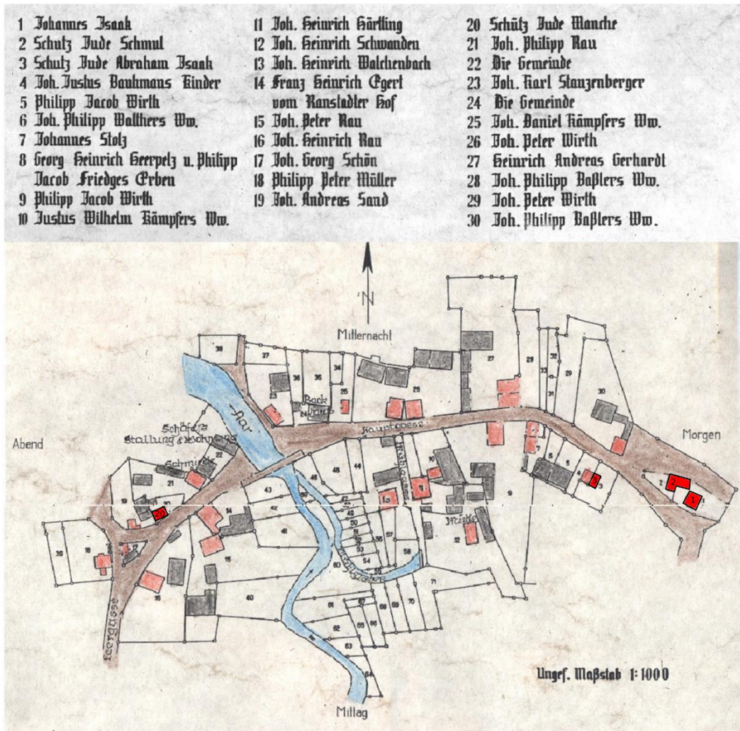
Abb. 1: Faksimile des Ortsplans von Hausen über Aar, übernommen aus der Urkatasterkarte von 1780 (das Faksimile befindet sich im Besitz der Familie Thomä). Die jüdischen Bewohner sind unter den Ziffern 1, 2, 3 und 20 aufgeführt. Ihre Wohnhäuser sind leuchtend rot markiert (heutige Grundstücke im Zum Mühlholz 2 (Nr. 1 und 2), Zum Wingert 21 (Nr. 3) und Zum Wingert 4 (Nr. 20).