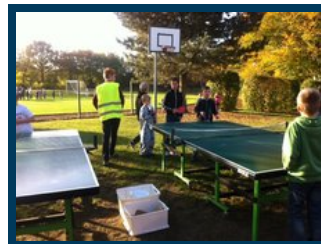
Legeeksperterne ledsager de yngre elever