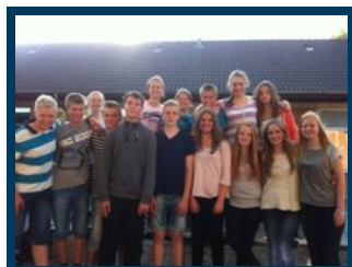
Legeeksperterne fra sjette til ottende klasse

Tilbage til sidens begyndelse Sidenr. 21076 Permalink 15-05-2016