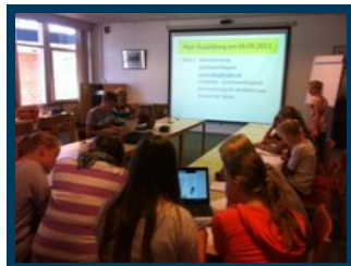
Der bliver fælles udarbejdet ideer til legene.