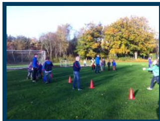
Elever fra alle aldersgrupper leger sammen "skatterøveri"

Du kan downloade den videofil i OGG Theora format ved hjælp af denne webadresse: