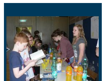
De ældre elever fra 8./9. klasse viste grundskolens elever ved stationen