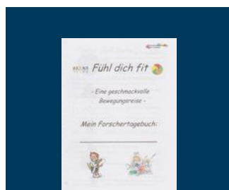
Det af ældre elever forberedte forskerhefte "Føl dig i form", ledsaget

På en hel speciel skoledag blev alle "Zentralschule Harrislee's" fjerdeklassers elever til nysgerrige forskere på områderne bevægelse og ernæring. Inden for projektdagen "Føl dig i form" afprøvede de, sammen med ældre elever fra 8. og 9. classes sundhedskurser, forskellige "schmeksexperimenter" og "bevægelsesfænomener" ved forskellige stationer. Peer Learning stod i projektets fokus. Derved formidlede ældre elever som eksperter forskerne fra grundskolen på en legagtig måde, at Soft drinks indeholder hemmelige ingredienser og at "prins fedtplet" gemmer sig især i chips og spegepølse. De bevægelsesstationer, som var lavet af eleverne, var meget populære. Disse var på den ene side etableret direkte til enhver ernæringsstation og på den anden side fokuserede de på sportens fornøjelse. Desuden sørgede et farverigt forskerhefte for, at denne vellykkede projektdag kan mindes i lang tid og at sund mad og en oplevelsesrig bevægelse forblev positivt i hukommelsen.