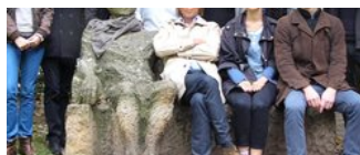
› Norbert Elias Center (NEC)