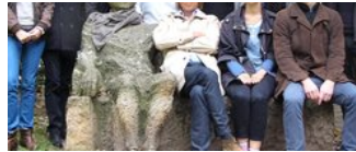
› Norbert Elias Center (NEC)