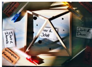
› Center for videnskabelig videreuddannelse (ZWW)