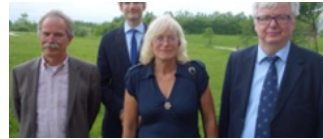
› Center for små og regionale sprog (under etablering)