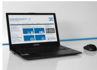
› Center for informations- og medieteknologier (ZIMT)