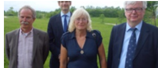
› Center for små og regionale sprog (under etablering)