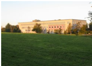
› Centralt Højskolebibliotek (ZHB)

Endelig råder universitetet over en række centrale institutioner med overvejende servicefunktion. Heriblandt tælles: