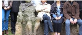
› Norbert Elias Center (NEC)