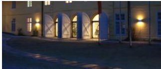
› Forschungsstelle für regionale Zeitgeschichte und Public History (frzph)