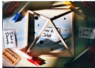
› Center for videnskabelig videreuddannelse (ZWW)