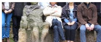
› Norbert Elias Center (NEC)