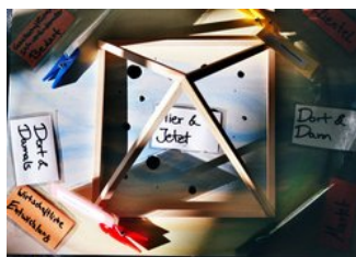
› Center for videnskabelig videreuddannelse (ZWW)