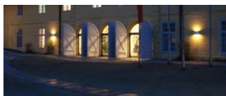
› Forschungsstelle für regionale Zeitgeschichte und Public History (frzph)