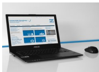
› Center for informations- og medieteknologier (ZIMT)