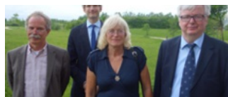
› Center for små og regionale sprog (under etablering)